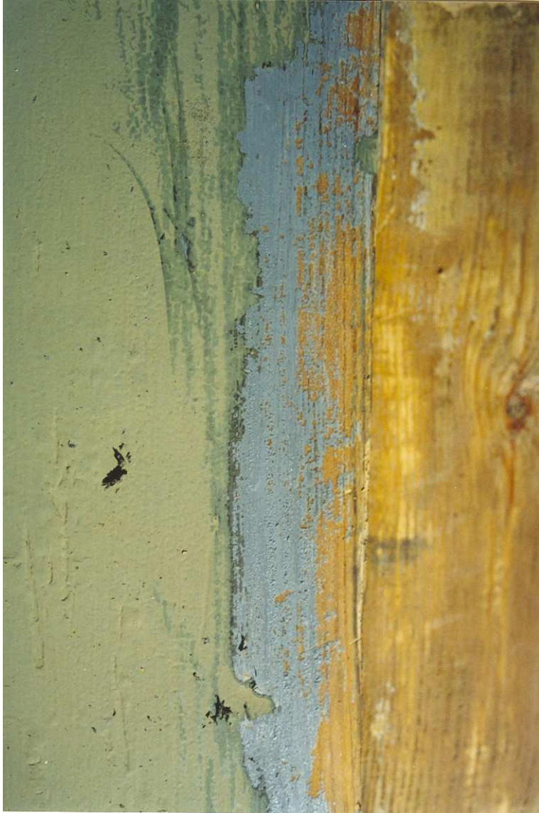
Äldre grått färgskikt på lisen. Troligen från första målningstillfället på Skansen. Film nr. 2925.