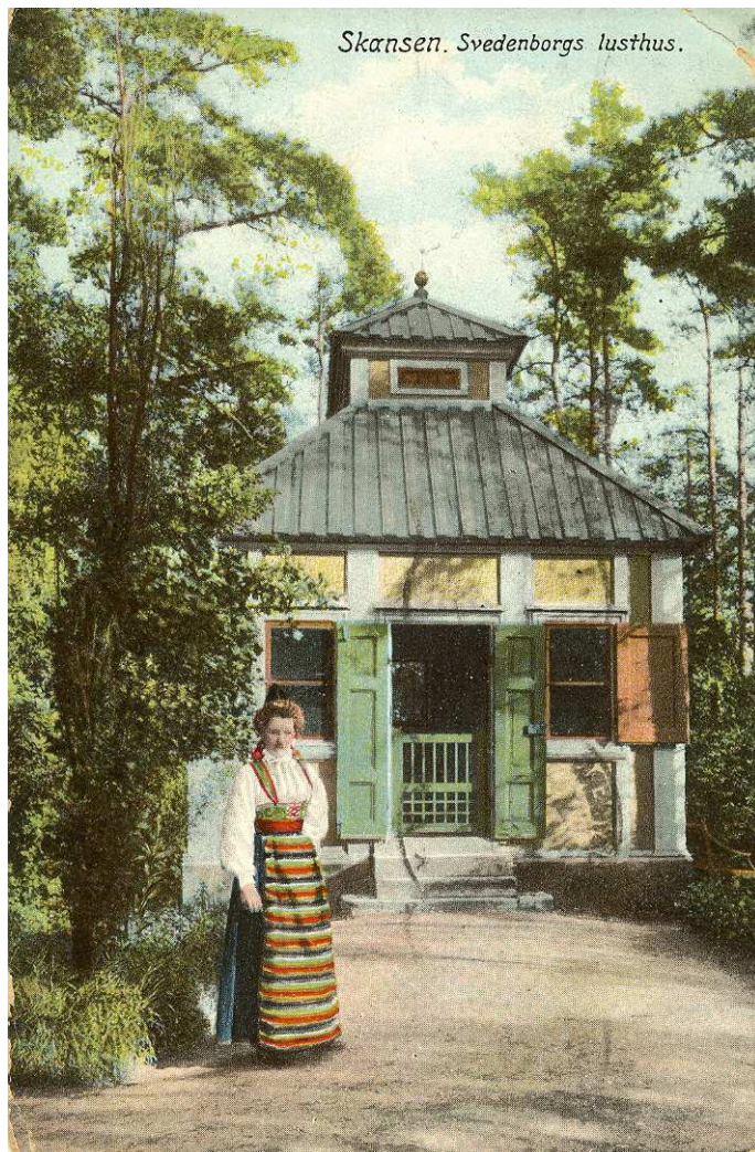
Vykort i Skansens arkiv.

Längst upp i vänstra hörnet på lanterninens östfasad påträffades gult färgskikt i botten. Härrör sannolikt från första målningen på Skansen.