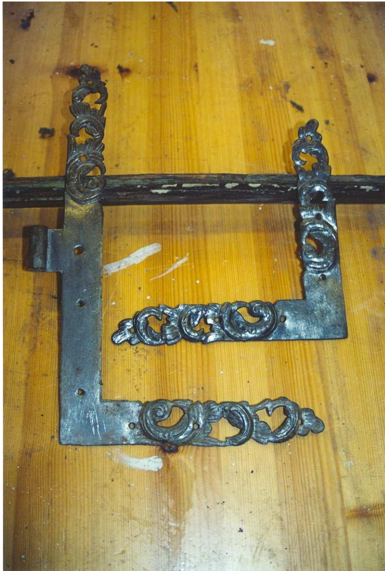
Hörnbeslag rengjorda i verkstan. Film nr 2925.