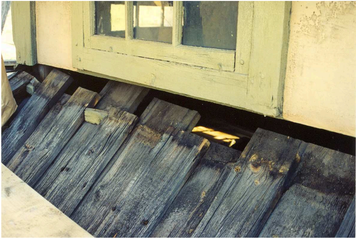
Taket före renovering. Film nr. 2925