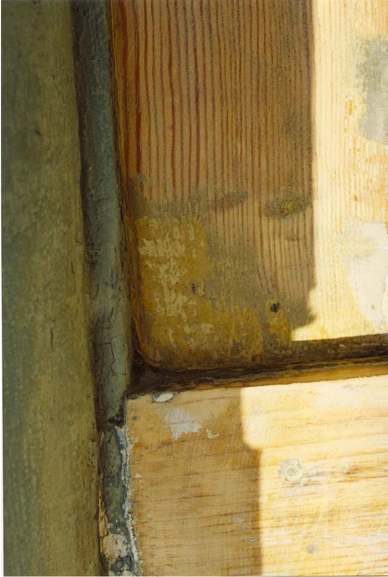
Äldre gult färgskikt i hörn på panelen. Film nr. 2925.